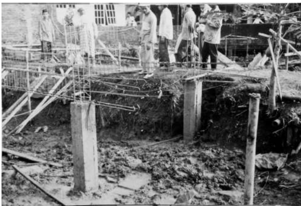
Gambar 3. Suasana Pembangunan Pesantren Miftahul Huda (Syahidin, 1994)