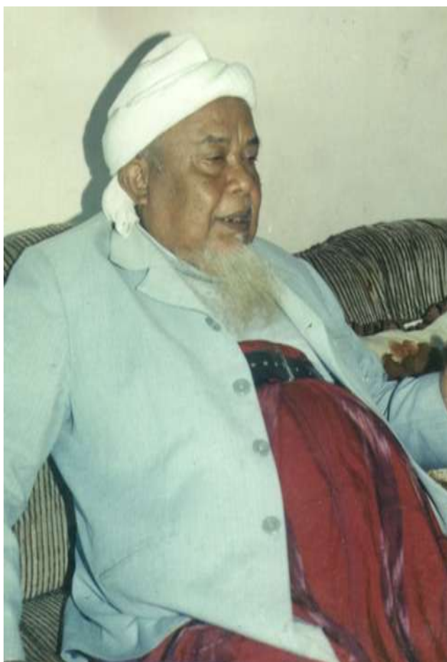
Gambar 1. KH. Choer Affandi