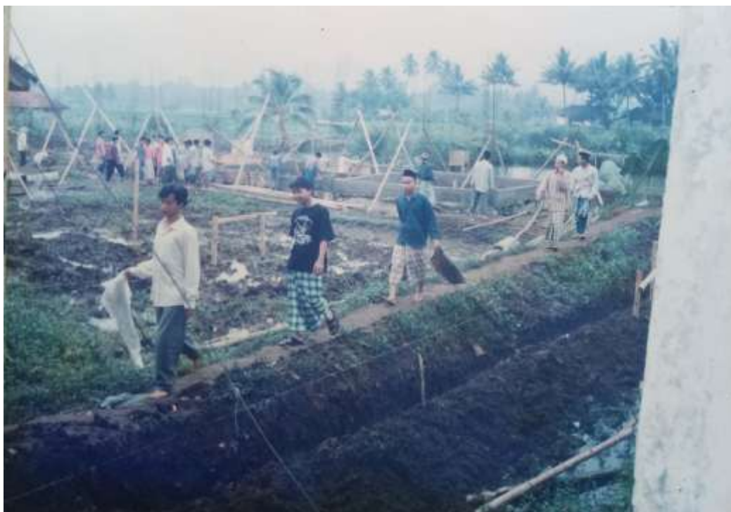
Gambar 10. Santri Miftahul Huda ikut terlibat dalam pembangunan pesantren (Syahidin, 1994)

Evaluasi pendidikan yang beliau lakukan yakni para santri di tes membaca kitab yang sudah dipelajari, jika santri tersebut bisa membaca kitab dan paham, maka akan lanjut ke jenjang selanjutnya. Adapun santri yang mau mukim, akan di tes langsung oleh beliau. Misi penyebaran Islam yang menarik dari segi pengkaderan yang beliau tanamkan terletak dalam tradisi mukim. Jika santri dirasa sudah mumpuni dan lulus dalam proses pembelajaran di pesantren, maka santri tersebut akan dimukimkan ke salah satu daerah untuk mengabdikan. Biasanya dalam tradisi mukim, beliau ikut serta mengantarkan santri tersebut, karena biasanya ada agenda tasyakur bersama masyarakat setempat, sehingga beliau biasanya menitipkan pesan kepada tokoh masyarakat setempat bahwa santri tersebut sedang belajar mengabdikan, dakwah dan menitipkan ekonominya supaya diperhatikan masyarakat.